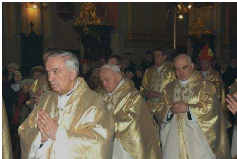
Przemyśl – Archikatedra