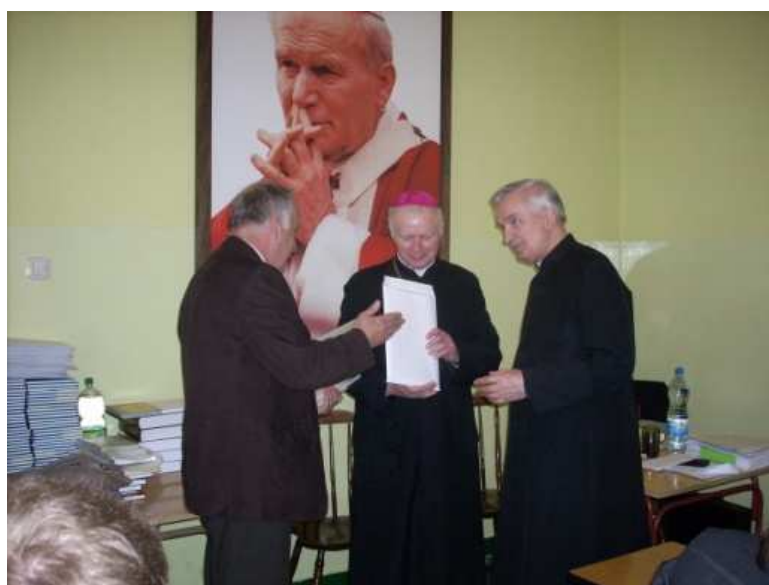
XIV edycja OKWB organizowanego przez Kat. Stow. „Civitas Christiana” u Sióstr Benedyktynek w Przemyślu – 2010 r.