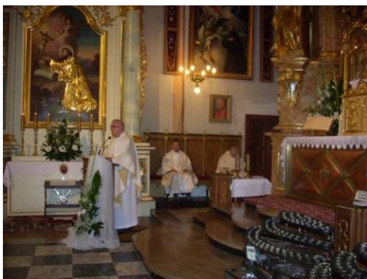
Kalwaria Paławska - Pielgrzymka „Civitas Christiana”