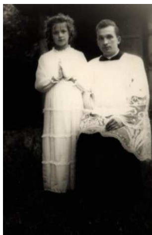
Lata kapłańskiej młodości - Sieniawa 1968