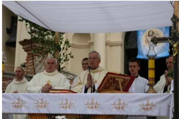
Boże Ciało – Jarosław