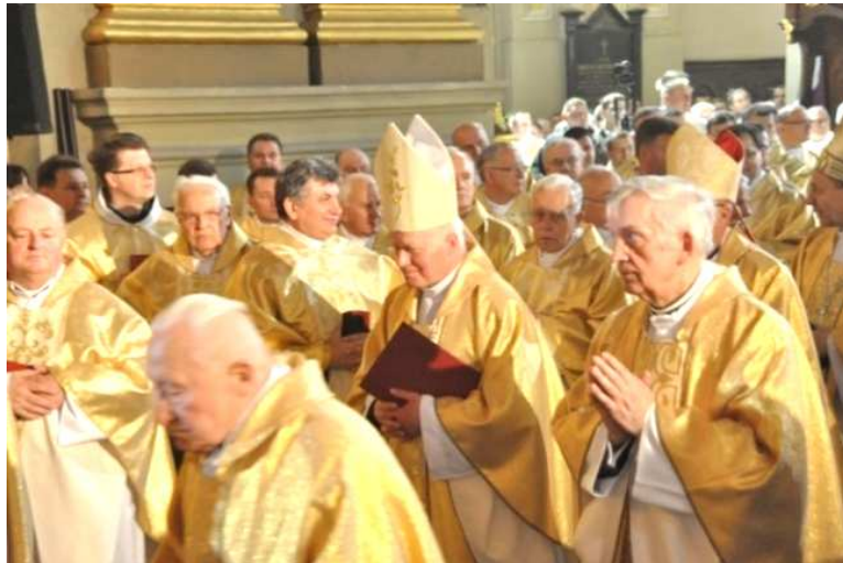
Przemyśl – Archikatedra – 50 lecie – Ks. Arcybiskupa