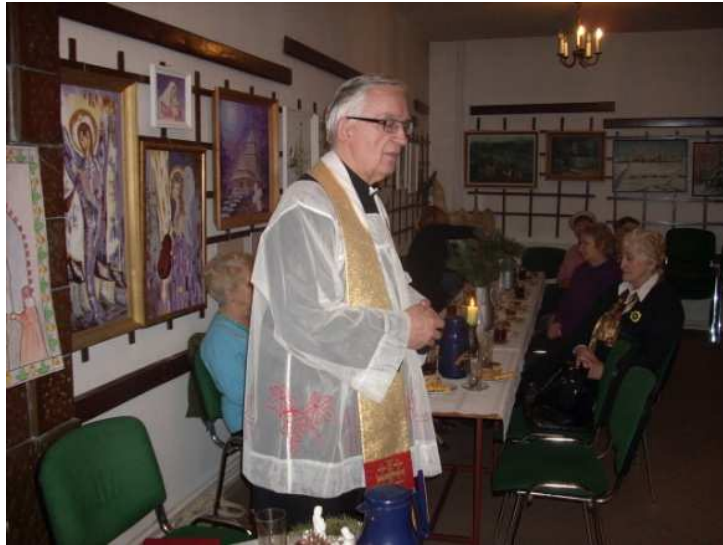
Kat. Stow. „Civitas Christiana” Przemyśl – Opłatek 2012 r.