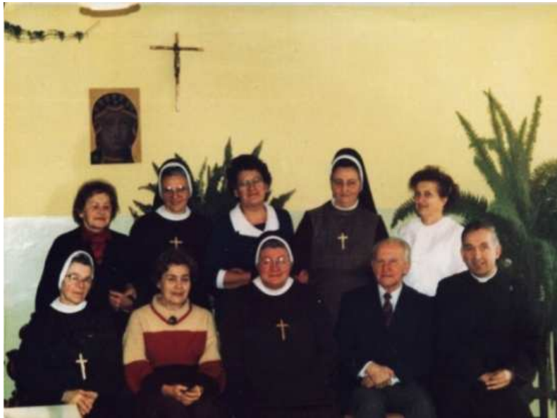
Siostry i pracownicy Kuchni Św. Br. Alberta iBł. Angeli