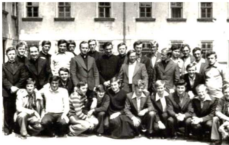
Seminarium Duchowne – Alumni 1982 przed obłóczynami