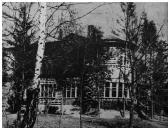
Willa NKWD w lesie katyńskim.

To w jej piwnicach prawdopodobnie mordowano polskich oficerów. W drugiej połowie lat 40. została rozebrana, a w latach 60-tych na jej fundamentach zbudowano sanatorium.